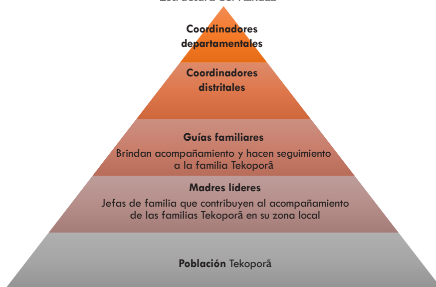
Gráfico 2 Estructura del Kakuaa